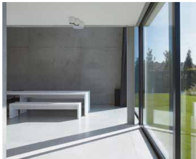
© A. Nullens - Arch. Th. Coucke

Les éléments intérieurs en béton sont soumis à des exigences esthétiques très sévères, dans la mesure où la surface bétonnée restera toujours apparente. Aussi utilisera-t-on généralement du béton autocompactant pour les applications en béton apparent.